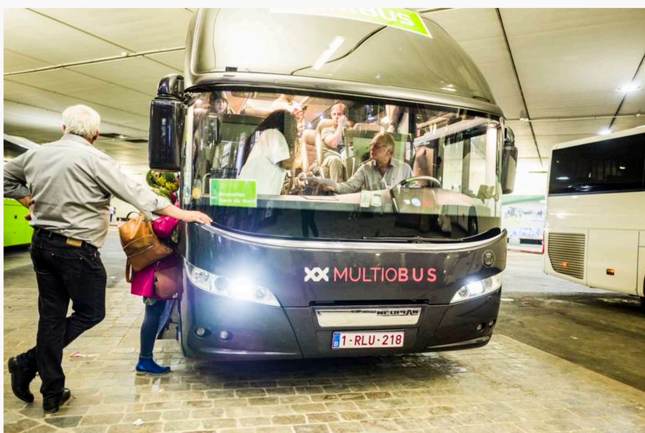
Gare routière de Paris-Bercy, le 9 août 2018.

En Haute-Savoie, un conducteur de cars, représentant du personnel de sa société, sous-traitante de Flixbus, a été licencié début janvier. Il dénonce la liquidation judiciaire de l'entreprise, des mauvais calculs du chômage partiel et se dit victime de harcèlement syndical.